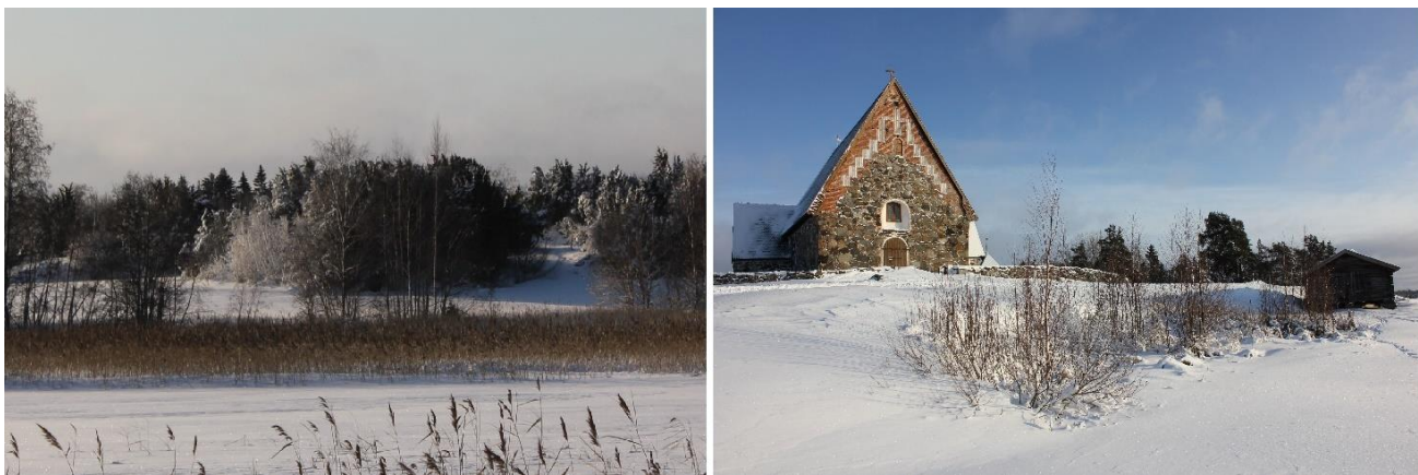
Näkymä kirkolta röykkiöalueelle ja röykkiöalueelta kirkolle. Kuvat Taina Leppilahti 2022.

Vielä tarkemmin vanhankirkonniemi ja Kallialan röykkiöalue voidaan määritellä osaksi Rautaveden länsirannan kirkkojen kulttuurimaisemaa. Vanha kirkko eli Pyhän Olavin kirkko on rakennettu 1500-luvun alussa paikalle, jossa tiedetään aikaisemmin sijainneen ainakin yksi puurakenteinen kappeli. Kirkko edustaa tyyliltään luonnonkivistä rakennettua keskiaikaista harmaakivikirkkoa, jonka pohjakaava on suorakaiteen muotoinen. Kallialan röykkiöalue on rautakauden aikainen muinaishauta, jollaisia löytyy joidenkin keskiaikaisten kirkkojen läheisyydestä.