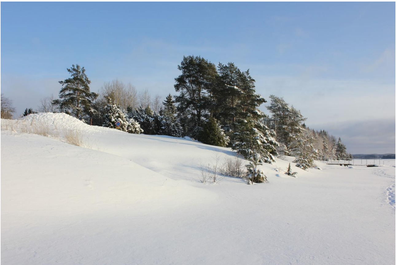
Minulle mieluisia maastonmuotoja vanhankirkonniemessä.