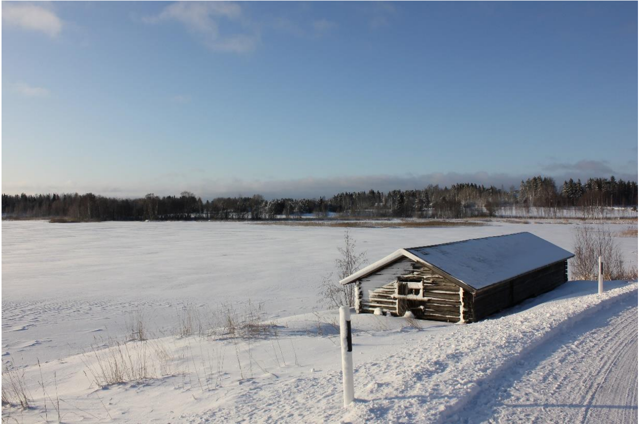
Näkymä vanhalta kirkolta kohti Kallialan röykkiöaluetta. Kuva Taina Leppilahti 2022.

On kaunis aurinkoinen talvipäivä. Minä ja veljeni hiihdämme mummun perässä jäällä rantaviivan tuntumassa. Suksi luistaa hyvin. Mieli on iloinen ja odotan, että kohta pääsemme laskemaan mäkeä. Suuntanamme on vanhankirkonniemi ja sen läheisyydessä sijaitsevat kumpareiset laidunalueet. Kun laitan silmäni kiinni ja palaan noihin lapsuusmuistoihini, voin yhä tuntea pakkasen kipristävän nenänpäätä, ja kuinka sukset kevyesti notkahtelevat umpihangessa mäkeä laskiessa. Näen, miten kuuset, katajat ja pienet männyt taipuvat paksun tykkylumen alla ja tunnen kuinka oksia suksen porkalla kevyesti tönäisemällä saa aikaan valtavan lumiputouksen. Aikamme mäkeä laskettua hiihdämme kirkon vierelle syömään mummun repussa olevia eväitä, kuumaa mehua ja voileipiä.