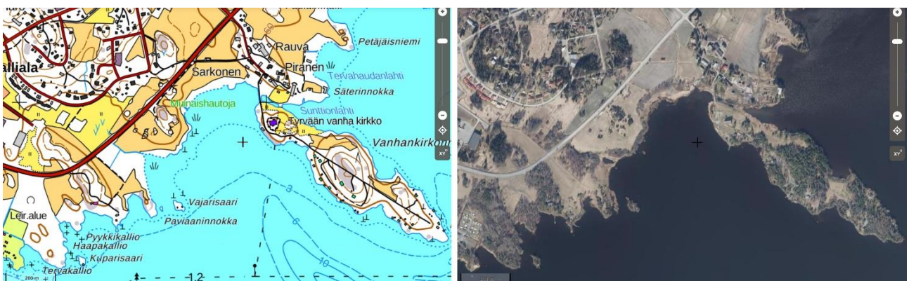
Vanhankirkonniemi. kartta- ja ilmakuvassa.

Tyrvään vanha kirkko ympäristöineen on oleellinen osa Pirkanmaan alueen valtakunnallisesti arvokasta Rautaveden kulttuurimaisema-alueetta. Pirkanmaan maakuntakaavassa Sastamalan Rautaveden kulttuurimaisema luokitellaan osaksi lounaista viljelyseutua, joka on pinnanmuodoltaan loivasti kumpuilevaa kankaremaata. Kallioperän kalkkisuus vaikuttaa suotuisasti viljelykasvien viljavuuteen ja näillä alueilla onkin laajoja hedelmällisiä savikoita. Maisema on jylhimmillään Karkusta Nokialle päin kuljettaessa. Aluetta voi hyvin luonnehtia maaseudun kulttuurimaisemaksi, joka on muovautunut perinteisten elinkeinojen ja maankäyttötapojen myötä. Alueen historialliset piirteet ovat säilyneet mm. rakennuskulttuurin sekä niitty- ja laiduntalouden kaltaisten luontotyyppien muodossa.