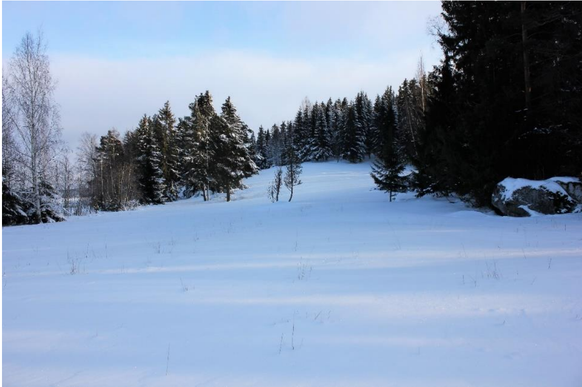
Laidunalue vanhan kirkon takana.

Lapsuudenmuiston myötä huomaan, että maisemaan ja ympäristöön sisältyy paljon muutakin kuin meitä ympäröivä näkymä, huolimatta siitä, onko kysymyksessä rakennettu ympäristö tai luonnonympäristö. Ympäristö ei ole ihmisen ulkopuolinen tila vaan siihen sisältyy huomattava määrä erilaisia arvoja ja jatkuvaa vuorovaikutusta ihmisten ja eri organismien kesken. Ihmisten ympäristössä vaikuttaa lisäksi vahvasti myös ihmisten keskinäinen vuorovaikutus ts. sosiaaliset ja kulttuuriset tekijät. Ympäristön arvoja ei siten voida arvioida pelkästään näköaistin avulla, vaan kaikilla aisteilla on tärkeä merkitys. Emme koe paikkoja vain värien, rakenteiden ja muotojen kautta vaan myös kuulemalla, haistamalla, hengittämällä ja tuntemalla ihon kautta. Ympäristön tärkeät elementit kuten tila, massa, koko ja syvyys koetaan ensisijaisesti keholla ympäristössä liikkumisen ja toimimisen kautta. Aiemmin alueen luokittelun yhteydessä esittämäni kulttuurimaisema tarkoittaa juuri ihmisen toiminnan myötä muokkautunutta ympäristöä. Maiseman esteettisyys muodostuu ihmisten asenteiden, arvojen ja tunteiden elinpiiriin jättämistä jäljistä. Minun toiminta vanhankirkon ympäristössä edusti virkistäytymistä, mutta alue pitää sisällään huomattavan paljon muutakin