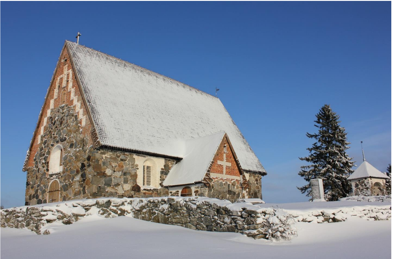
Tyrvään vanha kirkko.

Henkilökohtaisesti minua kiinnostaa ihmisen paikkasuhteen muodostuminen. Saksalaisen filosofi Martin Heidegger pitää paikkasuhteen muodostumista osana ihmisen identiteettiä. Hän kuvaa ”Rakentaa asua ajatella” artikkelissaan silta esimerkin avulla hyvin filosofisesti, kuinka rakennelma muuttaa koko maisemaa. Heideggerin ajatusmallin mukaan oleellista on oleminen ts. meidän tapamme toimia maan päällä ja rakentaminen, joka hänen mukaansa käsittää myös rakennusten hoitamisen ja vaalimisen. Vastaavanlainen vaikutus ympäristössään on mielestäni vanhalla kirkkorakennuksella.