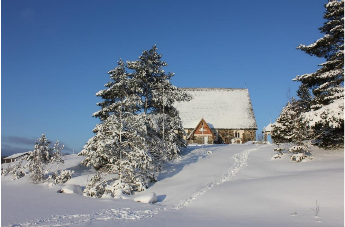
Tyrvään vanha kirkko kuvattuna Rautaveden suunnasta. Kuva Taina Leppilähti 2022.

Tyrvään vanha kirkko ympäristöineen on oleellinen osa Pirkanmaan alueen valtakunnallisesti arvokasta Rautaveden kulttuurimaisema-alueetta. Pirkanmaan maakuntakaavassa Sastamalan Rautaveden kulttuurimaisema luokitellaan osaksi lounaista viljelyseutua, joka on pinnanmuodoltaan loivasti kumpuilevaa kankaremaata. Kallioperän kalkkisuus vaikuttaa suotuisasti viljelykasvien viljavuuteen ja näillä alueilla onkin laajoja hedelmällisiä savikoita. Maisema on jylhimmillään Karkusta Nokialle päin kuljettaessa. Aluetta voi hyvin luonnehtia maaseudun kulttuurimaisemaksi, joka on muovautunut perinteisten elinkeinojen ja maankäyttötapojen myötä. Alueen historialliset piirteet ovat säilyneet mm. rakennuskulttuurin sekä niitty- ja laiduntalouden kaltaisten luontotyyppien muodossa.