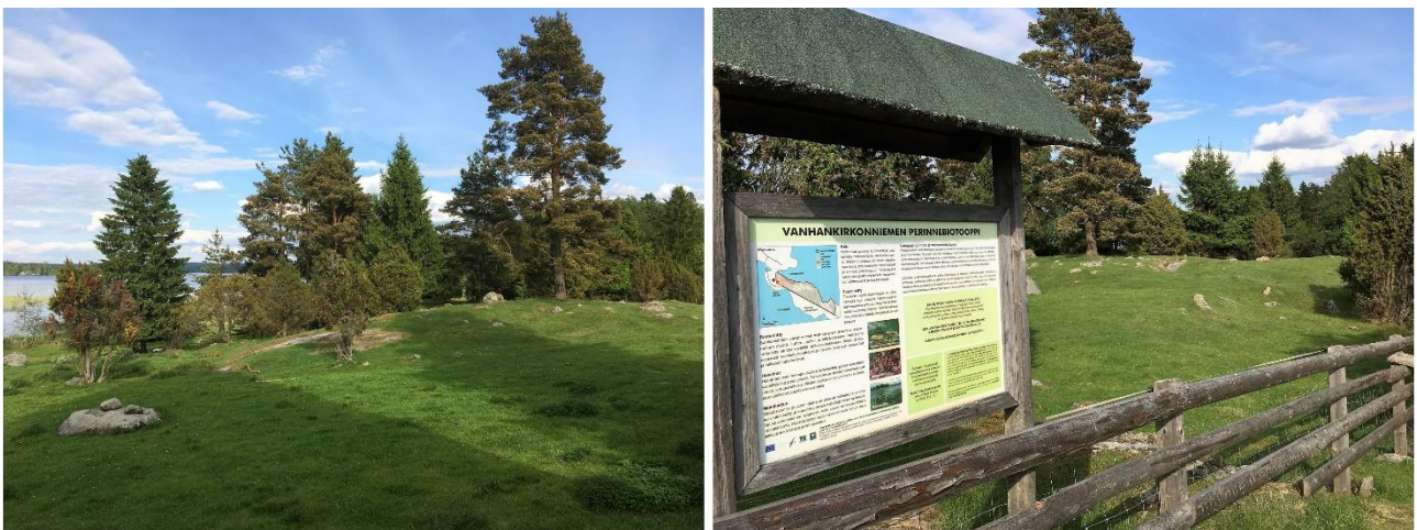
Vanhan kirkon laidunalueita suojellaan nykyisin perinnebiotooppina.