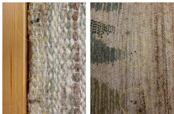
Tekstiilin kiinnitys seinään oli tehty tekstiilin läpi lyödyillä nauloilla.

Tekstiili on hyvin suurikokoinen. Pituutta sillä on 960 cm ja leveyttä 170 cm. Tekstiili on kudottua kangaspuissa kolmena erillisenä kappaleena, jotka on liitetty yhteen käsin ommelluilla saumoilla. Saumat kulkevat kuusikko-osan molemmin puolin. Materiaaleina kuvakudoksessa on käytetty useita eri tekstiilimateriaaleja mm. taitelijan itsensä kehräämää pellavalankaa, teollisia pellavalankoja, villalankoja, poppanakudetta (puuvilla) sekä hamppu- ja sisal-narua. Suuri osa materiaaleista on värjätty käsin tätä työtä varten. Suuritoisen tekstiilin valmistamiseen onkin taiteilijan kertoman mukaan kulunut aikaa 8 kk. Tekstiili on kiinnitetty seinään kaikista reunoistaan sekä kappaleiden yhdyssaumojen kohdilta tekstiilin läpi lyödyillä nauloilla.