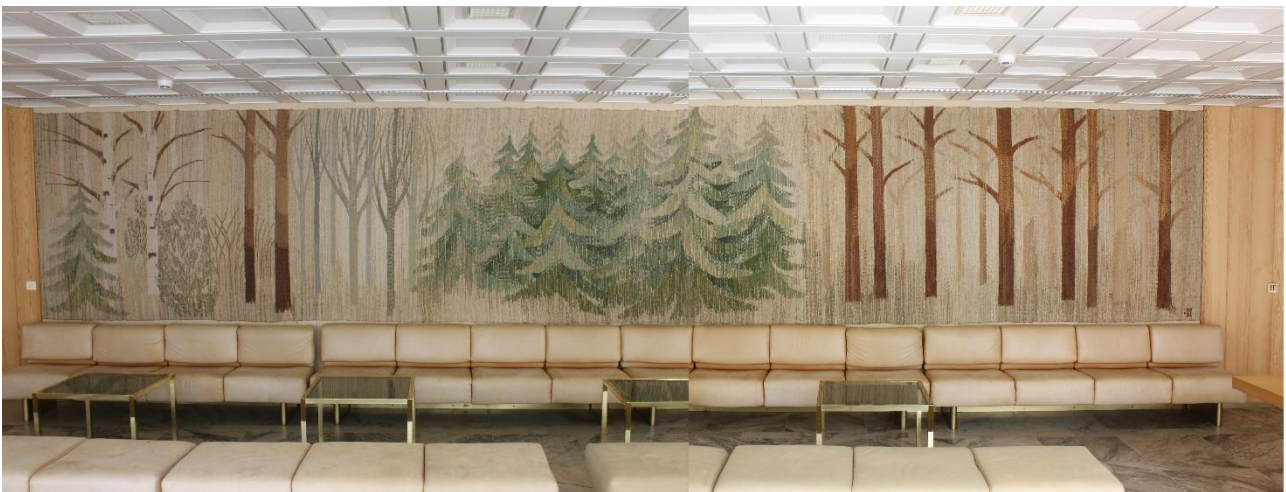
”Suomalainen metsä” alkuperäisellä paikallaan Kelan toimirakennuksessa Turun Luolavuoressa