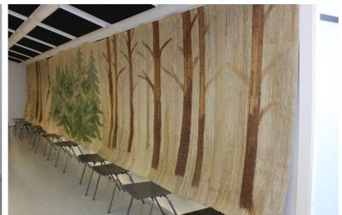
Tekstiilin kehys – Tekstiili valmiina laskostettuna seinälle nostettavaksi – Tekstiili nostettuna seinälle