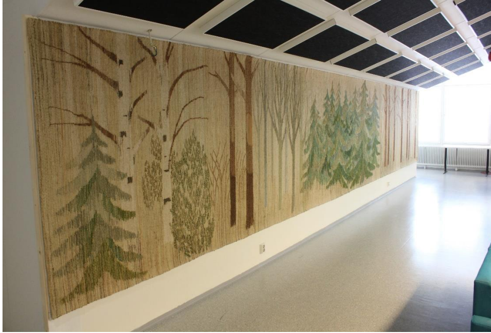
Tekstiili konservoinnin jälkeen ripustettuna uudelle paikalleen