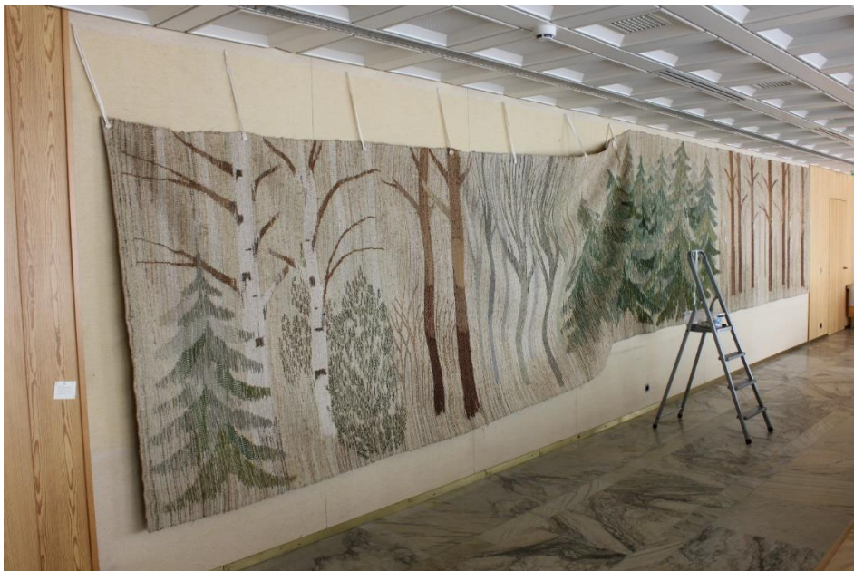
Väliaikaiset kannattimet estivät vedon ja jyrkän kulman syntymisen irrotetun ja vielä seinässä kiinniolevan tekstiilin rajakohdalle.

Yläreunan irrottaminen vaatikin hieman ongelmanratkaisua, sillä sen nauvoja ei voinut vain irrottaa järjestyksessä ja jättää tekstiiliä roikkumaan vähäksikään aikaan oman painonsa varassa. Aloitin irrottaa yläreunaa pieni osa kerrallaan, ja sitä myötä, kun sain sopivan matkan irti, kiinnitin yläreunaa väliaikaisille kannattimille samalla laskien tekstiiliä noin puoli metriä alemmas. Lopuksi leikkasin väliaikaiset kiinnikkeet yksi kerallaan poikki samalla kun keräsin tekstiiliä syliini. Näin tekstiilin seinältä lasku sujui hallitusti.