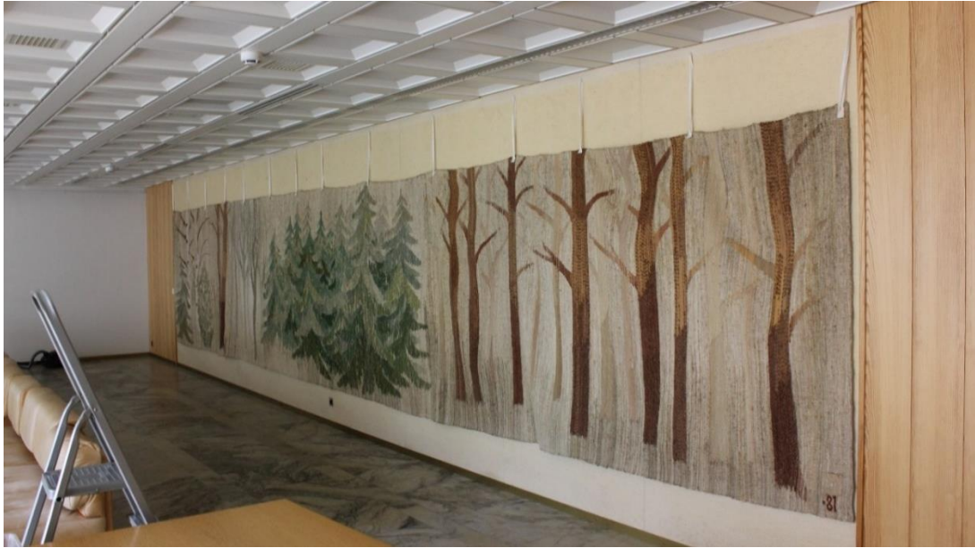
Tekstiili kokonaan irrotettuna väliaikaisten kannakkeiden varassa.

Irrottamisen jälkeen puhdistin tekstiilin imuroimalla sen molemmin puolin matalalla imuteholla, pakkasin ja kuljetin konservointitilaan. Konservoinnissa jatkoin pintapuhdistusta imuroimalla tekstiilin uudelleen molemmin puolin, mutta nyt tarkemmin ja hyvin pienellä suulakkeella. Muuta puhdistamista tekstiili ei sitten kaivannutkaan. Kiinnitin purkautuneet saumat pellavalangalla ja aloin valmistella tekstiilille uutta, tuettua ripustusta. Tukikankaana käytin pesemällä esikäsiteltyä pellavapalttinakangasta, jonka reunaan oli kiinnittänyt tarranauhan pehmeää puolta. Tuki kiinnitettiin kuvakudokseen käsin ompelemalla. Reunoissa käytin ompeluun pellavalankaa, keskemällä ohutta puuvillalankaa. Tekstiilin uuteen ripustuspaikkaan tehtiin kehysrakente, johon kiinnitettiin nitojalla tarranauhan karkea puoli. Tekstiili nostettiin paikalleen neljän henkilön avuin. Yläreuna ja kappaleiden välisten saumojen kohdat asetettiin suurin piirtein kohdilleen. Sen jälkeen minun oli helppo yksin asettaa se oikealle kohdalleen ja viimeistellä ripustus. Helman kiinnitin ihan lopuksi.